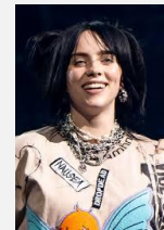
Billie Eilish, Sängerin