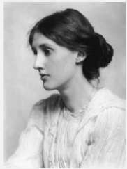
Virginia Woolf, Schriftstellerin, Verlegerin