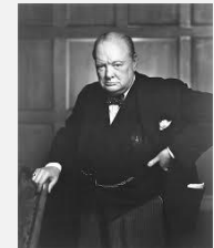
Winston Churchill, brit. Premierminister