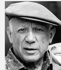
Pablo Picasso, Künstler