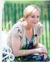
J. K. Rowling, Autorin