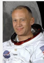
Buzz Aldrin, Astronaut